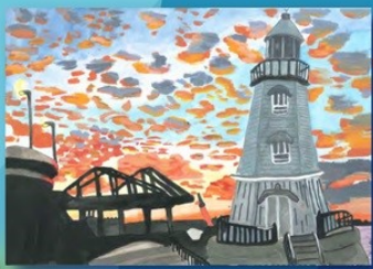
2022 小学生高学年金賞