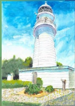
2022 小学生低学年金賞