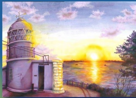
2022 海上保安庁長官賞