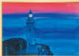
2019 小学生高学年金賞