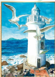
2019 海上保安庁長官賞