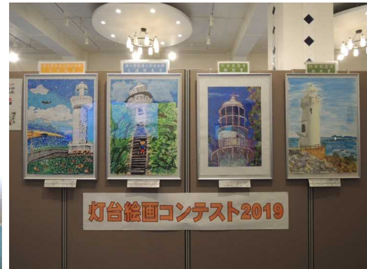
灯台絵画コンテスト入賞作品