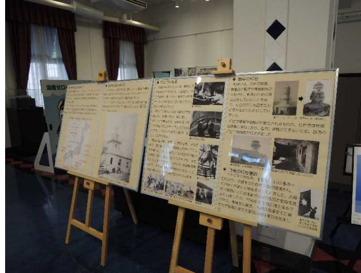
灯台の歴史等にかかるパネル