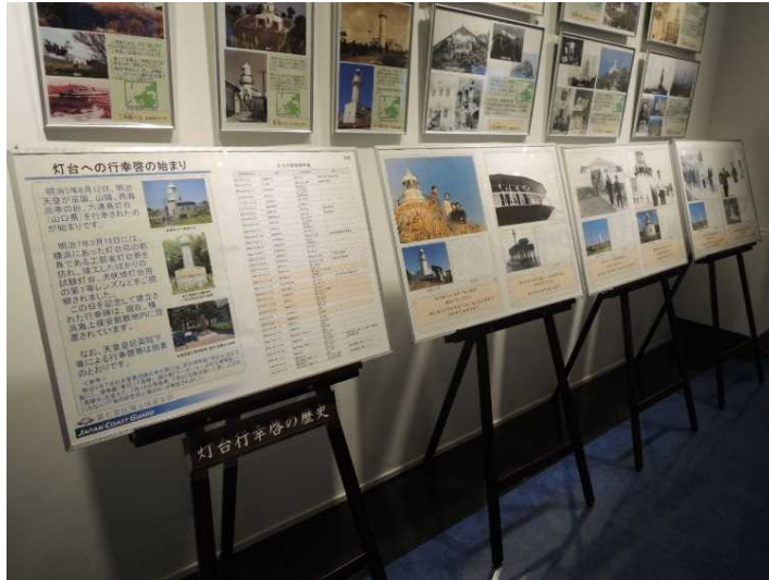
天皇陛下による灯台への行幸啓写真

令和元年10月12日(土)～11月10日(日) 午前10時～午後5時 (毎週水曜日休館)